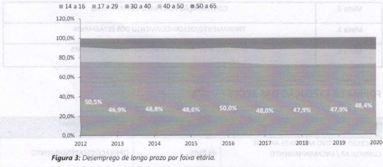
Figura 3: Desemprego de longo prazo por faixa etária.